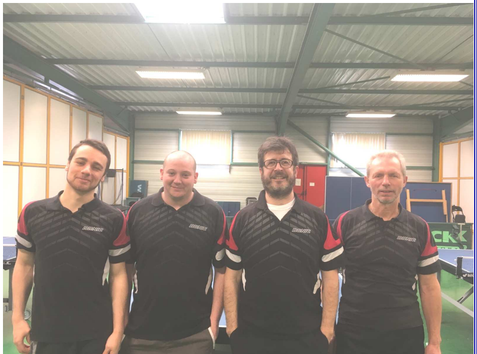
L'équipe de l'AS du Tertre

Au niveau du club la montée de l'équipe 1 ne fut pas la seule bonne nouvelle car elle a été par d'autres avec l'accession de l'équipe de départementale 1 à la pré régionale et celle de la départementale 3 à la départementale 2.