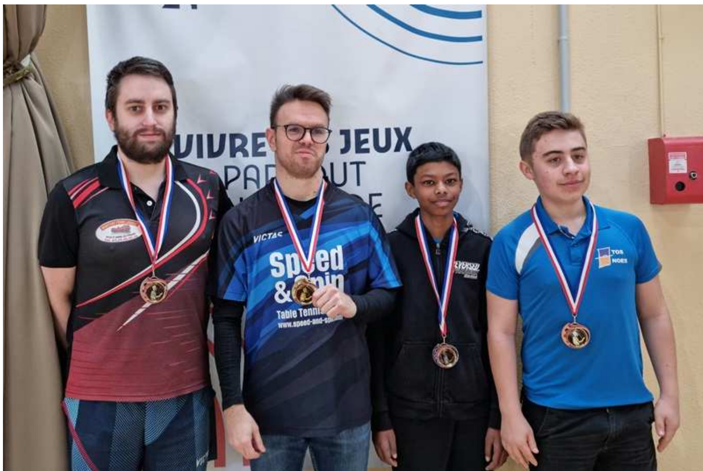
Tableau Messieurs H8