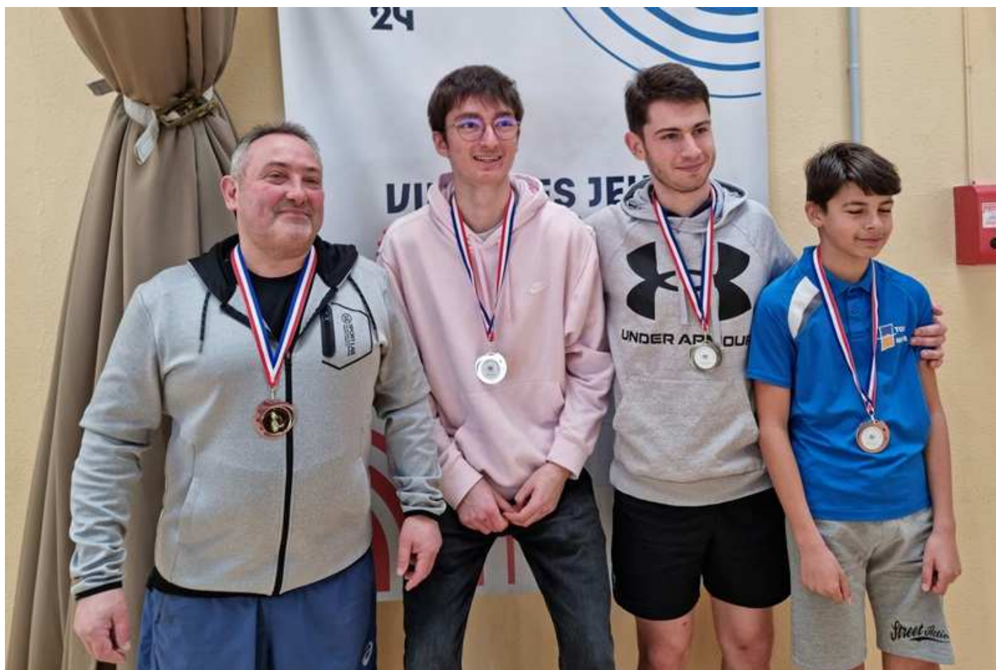
Tableau Messieurs H10