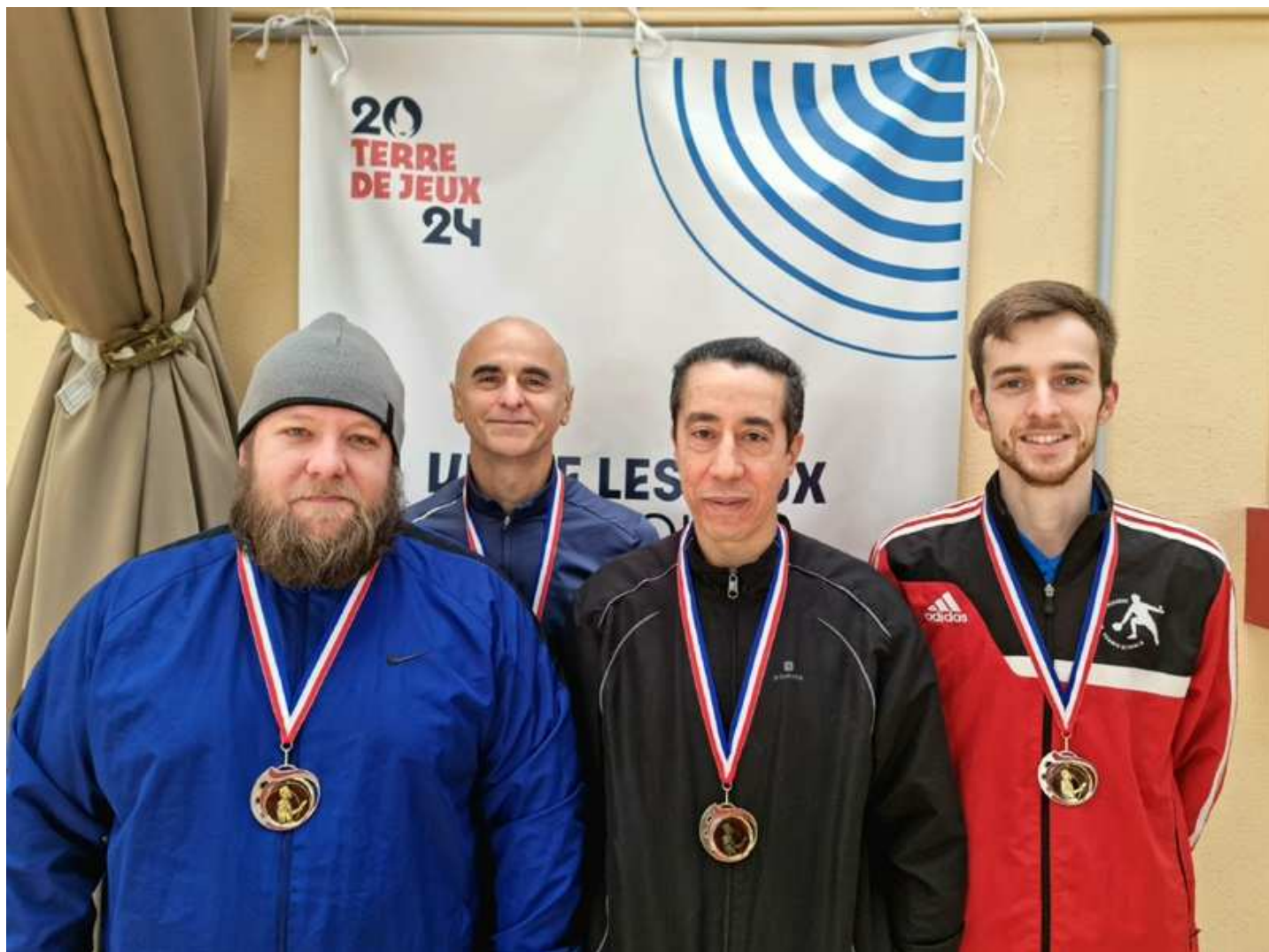
Tableau Messieurs H12 et H15 et H18